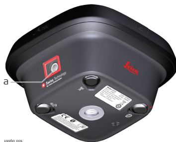
a Камера (GS18 I)